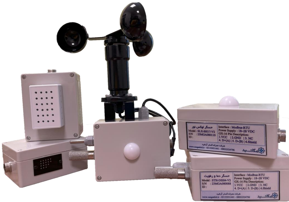
برخی از حسگرهای شرایط محیطی