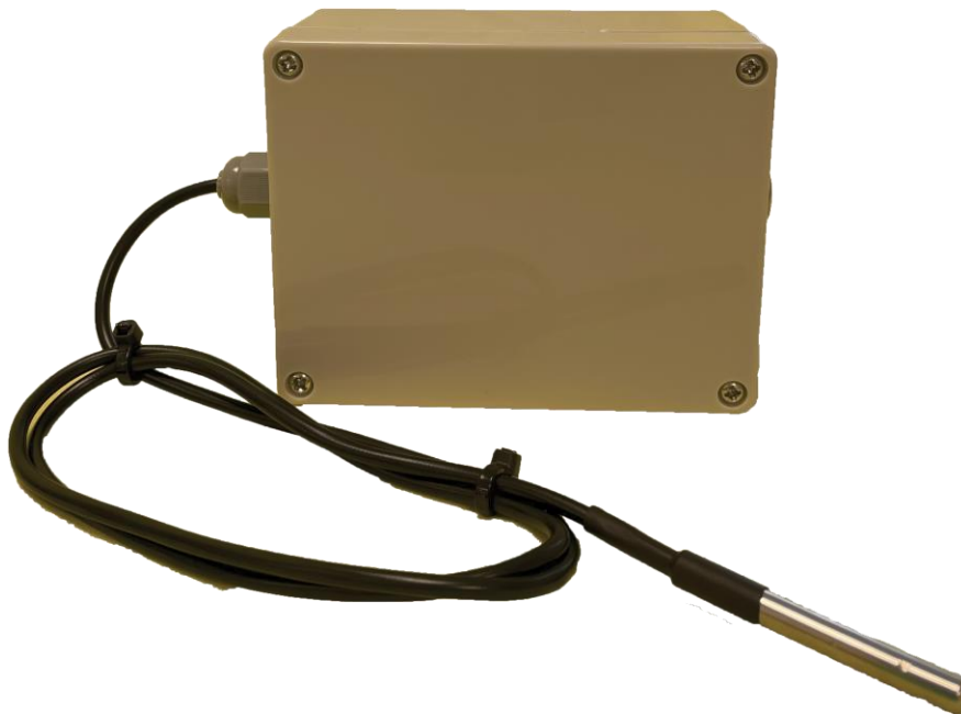
شکل ۱ نمای کلی ماژول STM-DS-R-V2